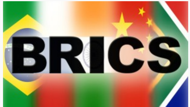
Gestern ging das sechste akademische Forum der BRICS-Staaten in Rio de Janeiro zu Ende.